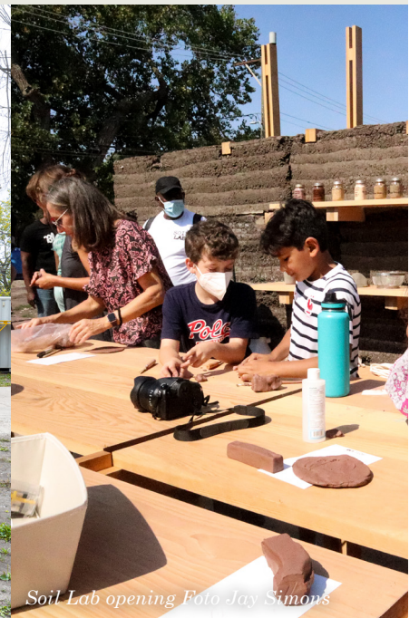
Soil Lab opening

I Danmark som i mange andre lande, er der i disse år et stort fokus på at skabe balancen og de rette rammer for livet i byen og på landet. Det handler både om den lokale sammenhængskraft og sociale dynamikker, men også om at adressere klimaudfordringer og skabe de fysiske rammer der understøtter vores grundlæggende værdier. Arkitektur og design sætter rammerne for vores liv og de offentlige rum, fælleskaber og mødesteder, der samler mennesker.