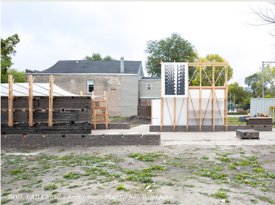
SOIL LAB Chicago Architecture Biennial