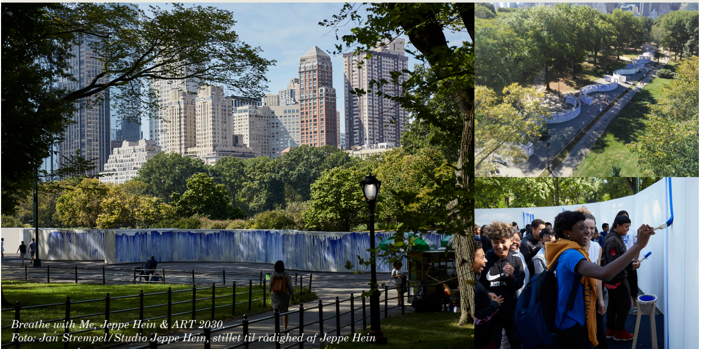
Breathe with Me, Jeppe Hein & ART 2030.

Danmark arbejder for at bidrage til indfrielsen af FN's 17 Verdensmål, der sætter kursen mod en mere bæredygtig fremtid i 2030. Særligt udmærker Danmark sig som et globalt forgangsland på den grønne dagsorden, hvor vi viser vejen med ambitiøse, nationale reduktionsmål og går forrest med innovative, grønne løsninger. Selvom vi er et lille land, kan vi gøre en stor forskel for en grønnere verden. Vi vil inspirere og motivere andre lande og arbejde for at øge den globale klimaambition og –handling. Og vi vil søge samarbejdsmuligheder på tværs af både geografiske og institutionelle grænser, i forsøget på at