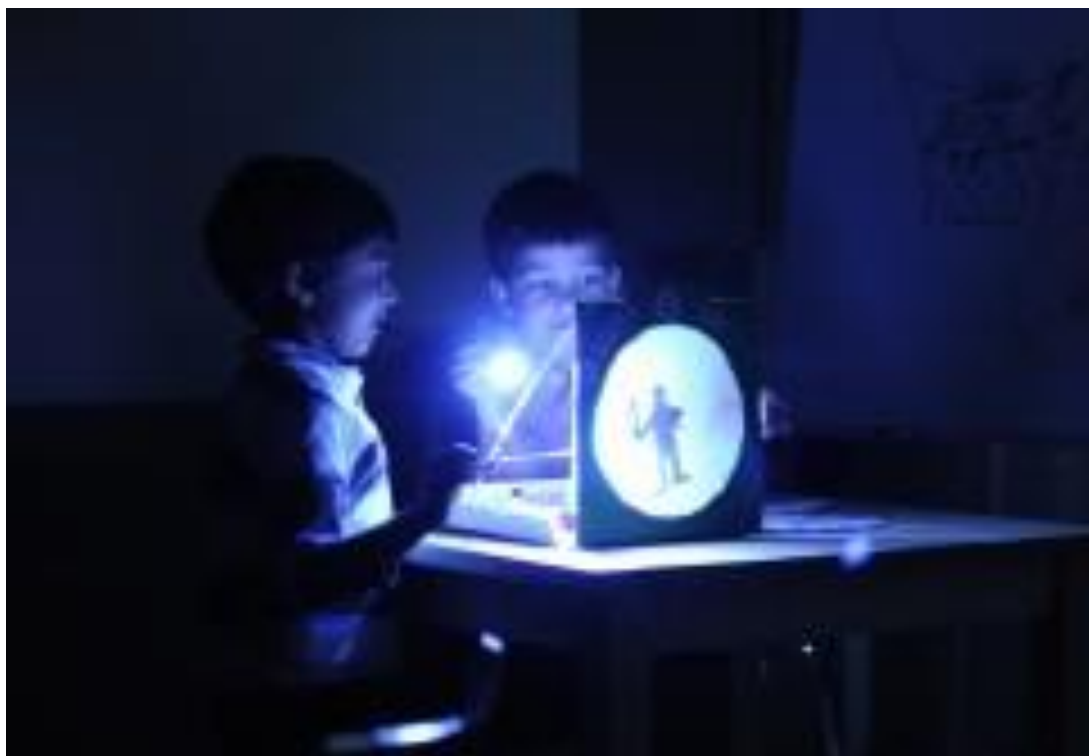
Historier leges frem gennem skyggespil

Vi oplevede, hvordan dét at "lege sig ind i" en anden tid og "møde" personer med helt andre levevilkår og tankesæt rejste mange umiddelbare refleksioner og filosofiske spørgsmål om, hvor vi kommer fra, hvordan vi lever, hvad vi lever af, og hvad der sker, når vi dør. Som indledning spurgte vi hver gang børnene, om de kunne huske noget af turen fra sidste gang, og det var tydeligt, at en overordentlig stor mængde info var lagret, fordi den var indlejret i en "oplevet" fortælling.