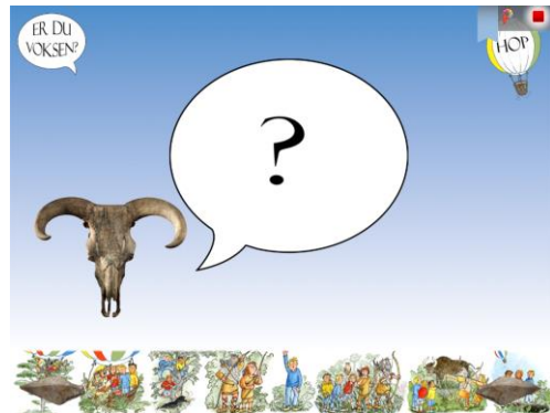
Screenshots fra den interaktive app Tidsballon