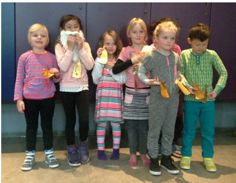
Medskabere fra Hadsundvejens Skole