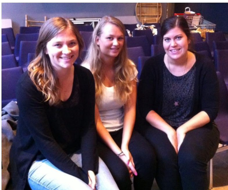
Tre af de pædagogstuderende fra VIA University College, Randers, der gav sparring til projektet og samtidig kunne bruge feltarbejdet på Museum Østjylland i deres uddannelse.

Samarbejdet med de pædagogstuderende har ledt til mange sjove og kreative ideer til, hvordan billedfortællingen vil kunne ledsages af lege, snak og aktiviteter, der involverer krop og sanser såvel ude i institutioner som inde på museet. Nogle af disse input kan nu findes i form af aktivitetsark, der kan downloades på www.tidsballon.dk og bruges i arbejdet med fortællingen ude i institutionerne.