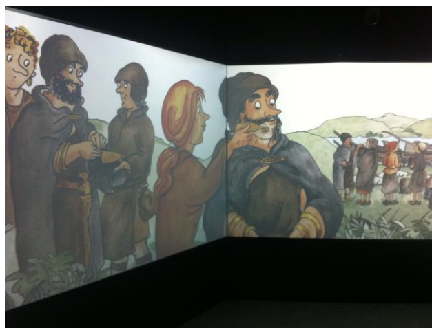
"Tidshjulet" forvandles til billedbog.